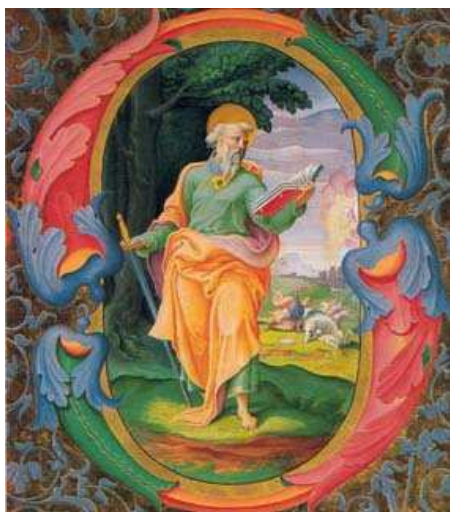
San Paolo - Miniatura

nos, de los excluidos (Rom 11,13). Por mentalidad, un hebreo no podía ir a misión fuera de su tierra; ésta es una verdad asombrosa.